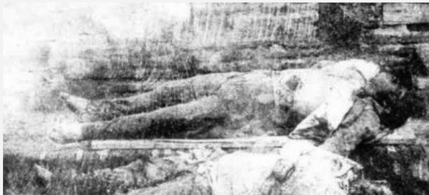
1918-ci il soyqırım qurbanları Victims of the 1918 Genocide