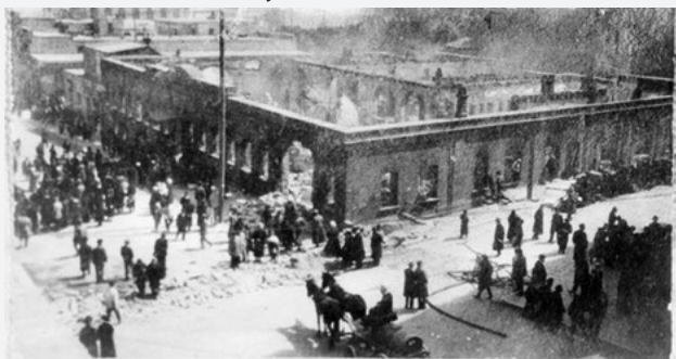
1918-ci il martında ermənilər tərəfindən yandırılmış "Kaspi" qəzetinin redaksiyası Editorial building of "Kaspi" newspaper burnt by Armenians in March of 1918